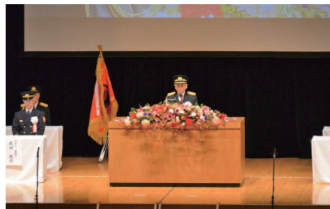
主催者挨拶をする日本消防協会 秋本会長